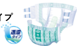
○簡単テープ止めタイプサイズ表

前後のウエストギャザーで背モレ・腹モレを防止。 足まわりの二つのギャザーで流れ・伝いモレを防止。