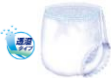
○はくパンツレギュラーサイズ表